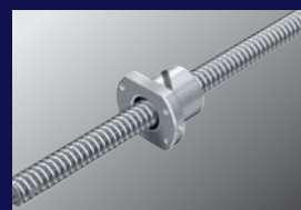
精密ボールネジを採用し、バックラッシュを大幅に軽減。

※切削条件 ●刃物:OGS EDS10 ●切削速度:20mm/sec ●回転数:6000RPM ●材料:円柱アクリル(半径40mm・高さ30mm)