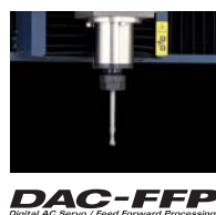
DAC-FFP Digital AC Servo / Feed Forward Processing

本体剛性のブラッシュアップをはじめ、一枚板テーブルの採用、内部演算処理の改良、スムージング性能の向上など、全身をグレードアップ。曲面はよりなめらかに美しく、仕上げ加工の手間も軽減。大型NC加工機などにも採用されているACサーボモータとDAC・FFPで、トルクと速度を常に最適な状態にコントロール。高速かつパワフルな切削加工を実現します。